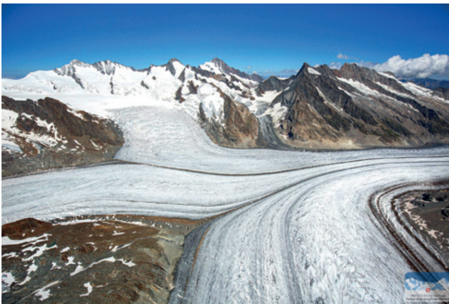
Konkordiaplatz: Konkordia = Einigkeit. Hier vereinigen sich von unten Grosser Aletschfirn, Jungfrau firn von links, Ewigschneefeld von vorne links und Grüneggfirn in grau von geradeaus zum Grossen Aletschgletscher.