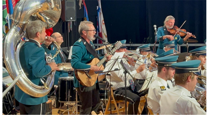
Mit Walliser Seema am Oberwalliser Musikfest in Ried-Brig